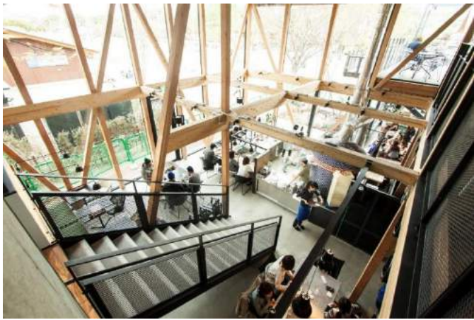
大きな吹き抜け空間 天井高は約8.5mのスケール