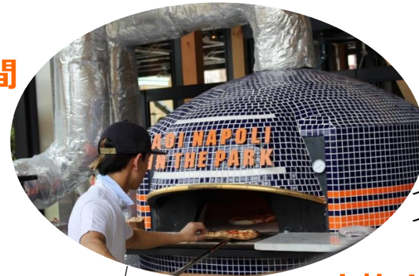
イタリア・ナポリ製の薪窯でピッツァイオーロが焼く、本格ナポリピッツァを提供。