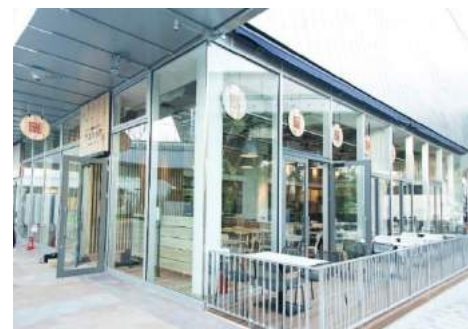
緑を眺めるオープンテラス ガラスウォールの開放感あふれるインテリア

■URL： http://www.asushoku-morinomiya.com/