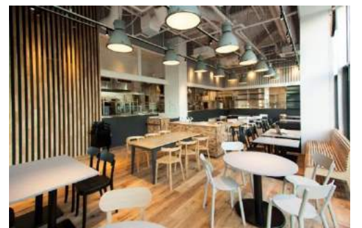
店内は木目調の空間で、 ゆったりした時間が過ごせます。