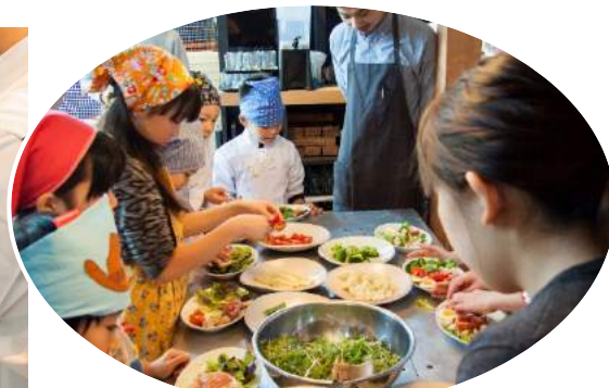
↑各店で開催しているキッズの料理体験教室