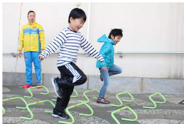
↑キッズかけっこ教室（東京・両国テラスにて開催）