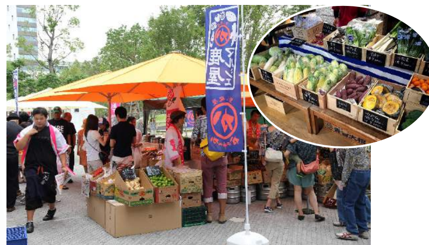
↑鹿児島県鹿屋市などから届く、良質な食材を用いたマルシェの開催