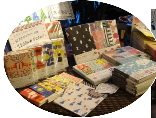
→本の販売展示会（東京・蔵前で毎年開催）