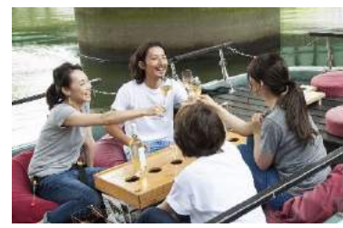
船上で優雅に乾杯！ピンチョス つまみつつの贅沢な時間！