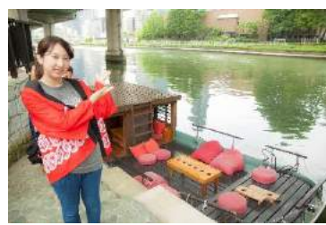
乗船所までご案内！ いよいよプランスタート！