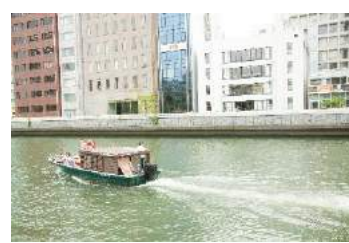
50分たっぷり揺られて クルーズ終了！