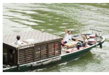
②18:10頃～ 食前御舟かもめ、出発！