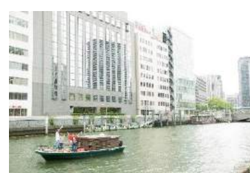
いつもの大阪の新しい魅力、発見！ ぼーっとしたり、写真を撮ったりご自由に。