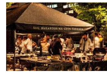
フリードリンク付！BBQプランスタート！ 後は思う存分楽しんで！