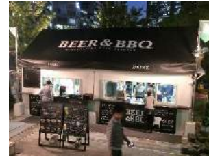
③19:10頃～ 再びオープンテラスへ！