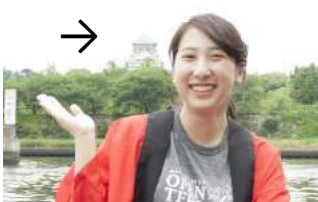
大阪城など 観光名所もご案内